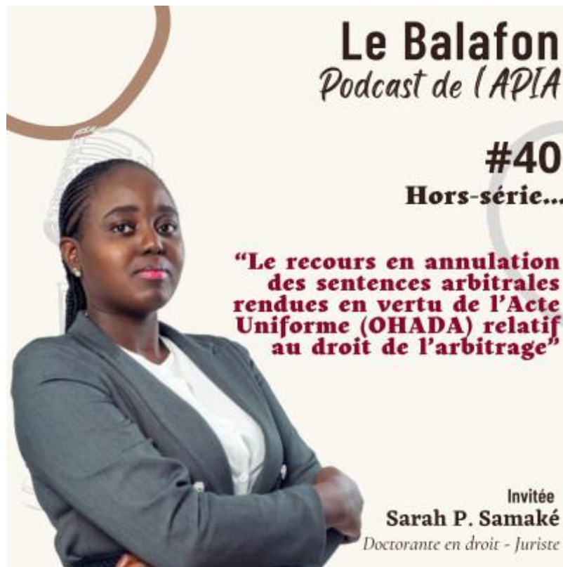
Le Balafon, Podcast de l'APIA, #Episode 40