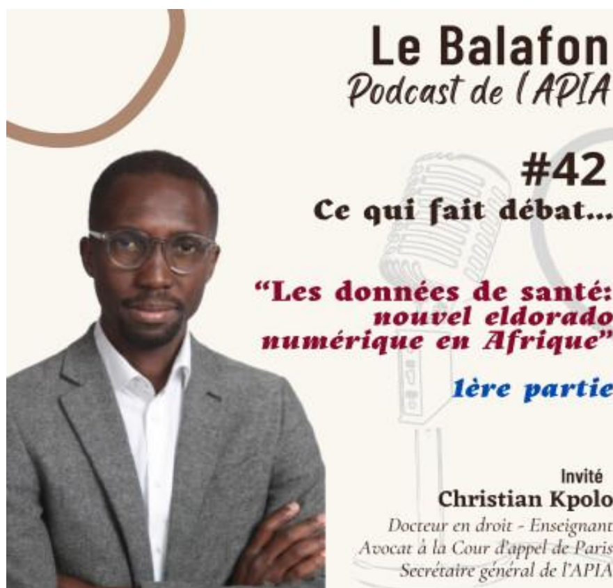
Le Balafon, Podcast de l'APIA, #Episode 42