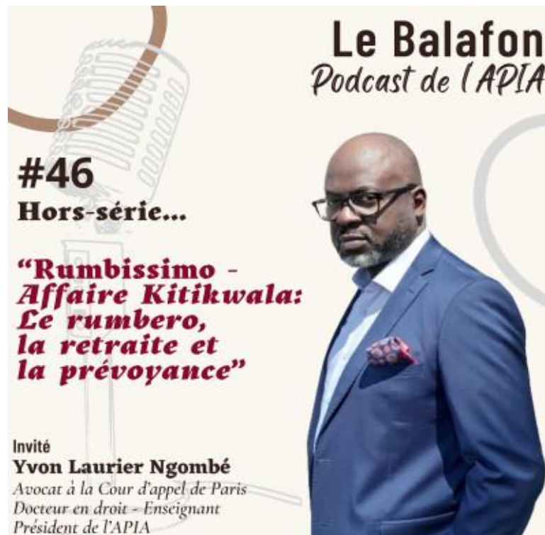
Le Balafon, Podcast de l'APIA, #Episode 46