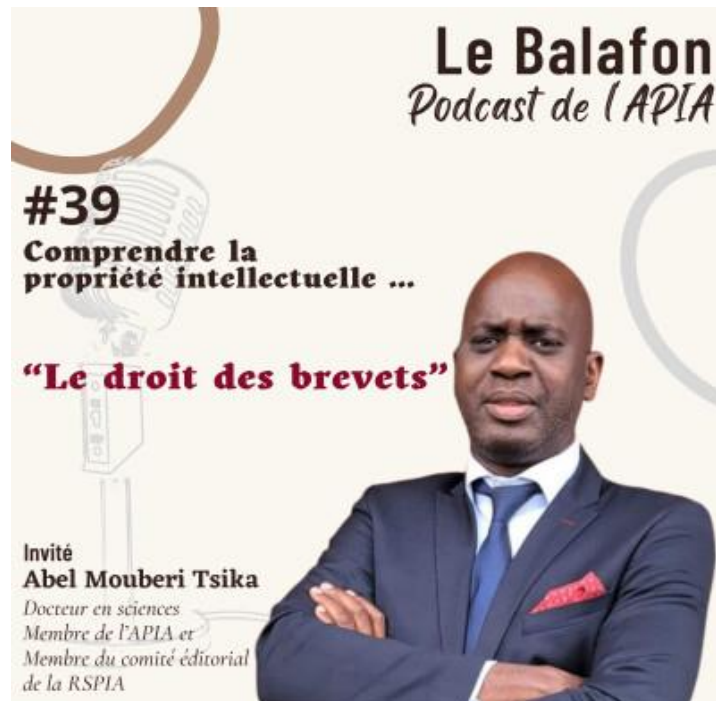
Le Balafon, Podcast de l'APIA, #Episode 39

ZERAOUI SALAH (Farha), « Contrefaçon et consommation en droit algérien de la propriété intellectuelle : les comportements du consommateur », in Les Cahiers de propriété intellectuelle , Vol. 37, n°1, printemps 2025, pp. 207-230